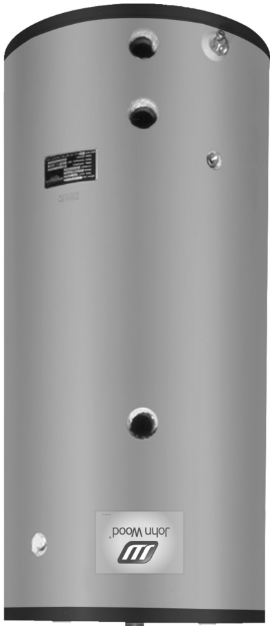
JWCE-119 - modèle isolé illustré